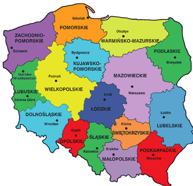
Wykres 1. Mapa Polski z podziałem na województwa

Trzy województwa - lubelskie, małopolskie i opolskie - wskazały społeczność romską jako bezpośrednich beneficjentów działań w ramach celu szczegółowego j , tj. integracji społeczno-gospodarczej grup marginalizowanych. Województwo lubelskie zaplanowało działania w zakresie edukacji, wsparcia zawodowego i integracji społecznej, ze szczególnym uwzględnieniem aktywizacji kobiet romskich i przeciwdziałania dyskryminacji. Województwo małopolskie, jako region z jedną z największych populacji romskich w Polsce, zaplanowało kompleksowe działania związane z edukacją, zatrudnieniem i integracją, ze szczególnym uwzględnieniem aktywizacji kobiet i młodzieży. W województwie opolskim wsparcie obejmuje zarówno działania edukacyjne, jak i zawodowe, a także wysiłki na rzecz zwalczania stereotypów i wzmocnienia organizacji społeczeństwa obywatelskiego reprezentujących interesy społeczności romskiej.